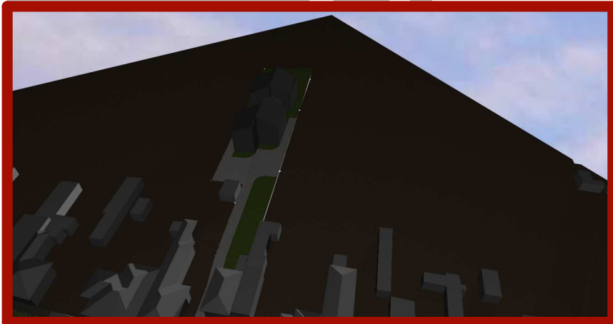
RASARIT 5 AM